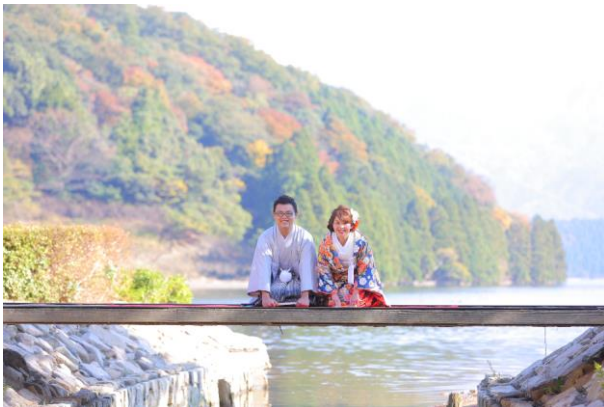
↑ 三方五湖を背景に思い出の1枚