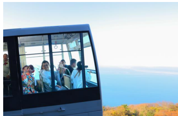
↑ 観光で来られていた方の祝福の声に応えるお二人