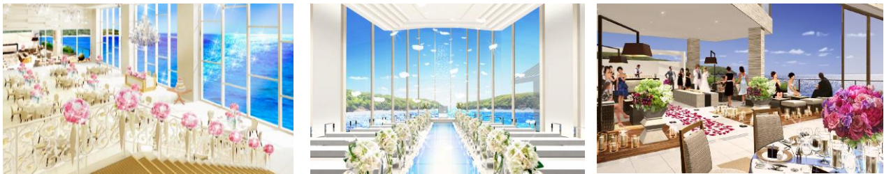
左からバンケット、チャペル、スカイテラス

ハーバーテラス SASEBO 迎賓館 HP: http://www.ikk-wed.jp/sasebo/