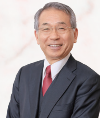
代表取締役会長兼社長CEO

株主の皆さまには、平素より格別のご支援・ご厚配を賜り、心より御礼申し上げます。 また、依然として続くウクライナ侵攻における人道危機により、困難な状況に置かれている多くの方々にお見舞い申し上げます。一刻も早く安全で平和な日々が取り戻されることを心より祈念いたします。