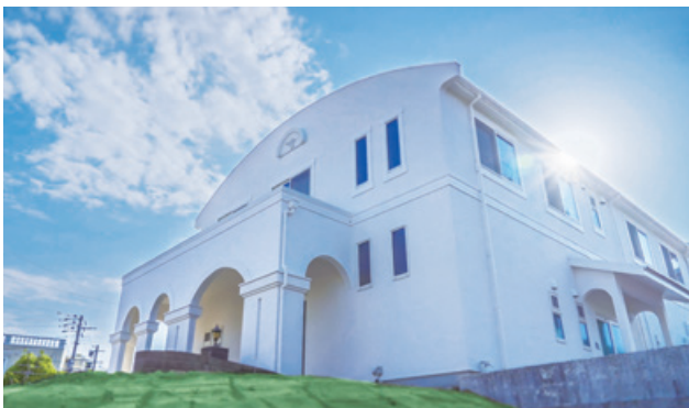
福岡県糟屋郡にて稼働

施設名 studio clori.TOKYO 新宿 所在地 東京都新宿区西新宿6丁目5-1 新宿アイランドタワー44F 開業日 2025年秋～冬（予定） 設備 フォトスタジオ 最寄り駅 東京メトロ丸ノ内線 西新宿駅 都営大江戸線 都庁前駅/新宿西口駅 JR東日本 新宿駅