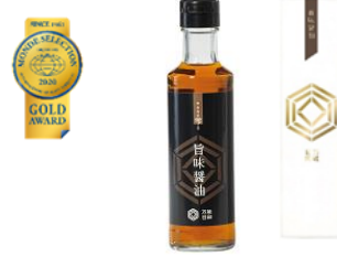
優秀品質金賞:キセキの雫「旨味醤油」 後を引く塩味と旨味のバランスの取れた黄金色の醤油