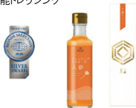
優秀品質銀賞:ドレッシングマスターズ「人参」 大阪のプレミアム人参「あやほまれ」の美味しさを最大限に表 現したまるやかドレッシング