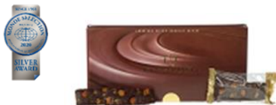
優秀品質銀賞:「大人のぜいたくショコラガトー」 3種類の高濃度カカオを絶妙にブレンドし、濃厚なカカオのピタ ースイート風味を最大限に生かした大人のためのショコラガトー