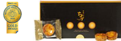
優秀品質金賞:茶菓の匠「ちーず」 絶妙な焼き加減でレアチーズ・ベイクドチーズ・グラハム(粗挽き 小麦)の美味しさを一口に詰め込んだチーズケーキ