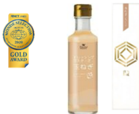
優秀品質金賞:ドレッシングマスターズ「玉ねぎ」 玉ねぎの美味しさをまるやかでクリーミーな味わいで表現 万能ドレッシング