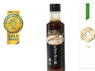
優秀品質金賞:「極みかぼすぽん酢」 大分県産かぼす果汁を規格外に使ったぜいたくポン酢