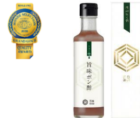
キセキの雫「旨味ポン酢」

「旨味ポン酢」は本醸造醤油に昆布とカツオの出汁で旨味をプラスし、ゆずとかぼすの 2 つの柑橘系果実をブレンドすることで、すっきりとした味わいを表現しました。保存料・香料無添加で、どんな料理にも合う万能調味料です。