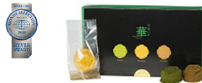
優秀品質銀賞:茶菓の匠「華」 八女産の抹茶・ほうじ茶、香川県産和三盆をふわふわしっとり 食感で仕立てたおもてなし菓子