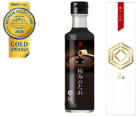
優秀品質金賞:「極みのたれ」 醤油・にんにく・清酒・水飴が絶妙なバランスの究極肉たれ