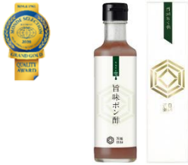
優秀品質最高金賞:キセキの雫「旨味ポン酢」 ゆずとカボスのw 果汁で程よい旨味と酸味の万能調味料