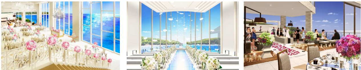
左からバンケット、チャペル、スカイテラス

ハーバーテラス SASEBO 迎賓館 HP: http://www.ikk-wed.jp/sasebo/